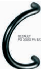
BEZAUPT PG 3020 PA EA300

Entraxes : 200 et 300 mm Finition : polyamide aspect brillant teinté dans la masse Coloris : blanc, gris, noir Kit de fixation à commander séparément